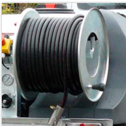
80m 1/2" (ND13) przewodu ciśnieniowego zamiast 50m