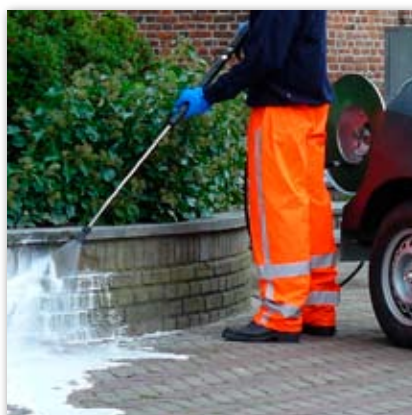
Pistolet ciśnieniowy z lancą oraz dyszą