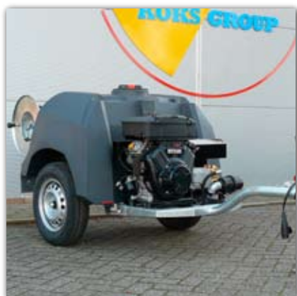
ROM SmartTrailer (standard bez pokrywy zespołu napędowego)