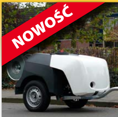
Zaprojektowana pokrywa dla zapewnienia ochrony zespołu napędowego