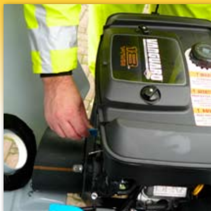
Elektryczny rozruch silnika