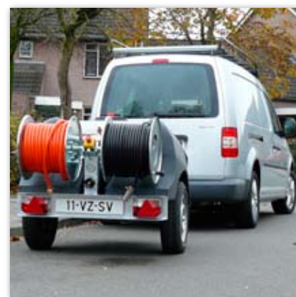
Kompaktowe wymiary oraz niska waga pozwalają na przechowywanie w niewielkich pomieszczeniach