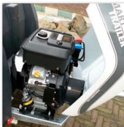
Zamykana osłona zespołu napędowego z szerokim kątem otwarcia – idealna do obsługi serwisowanej przedziału silnik/pompa