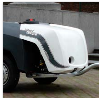
Pasek "SmartTrailer" na pokrywie zespołu napędowego