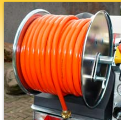
Galwanizowany bęben z węzłem 50 m. 3/4" do zasilania w wodę