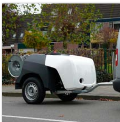
ROM SmartTrailer (opcja zawierająca pokrywę zespołu napędowego; kolor RAL9010 Czysta Biel)